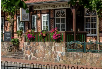
Hotel Acht Linden